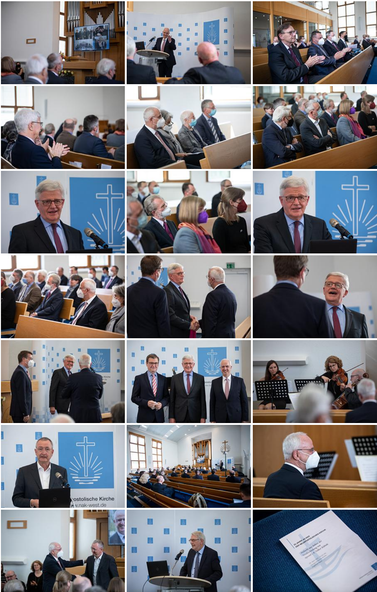
Bischof Kramer übernimmt Vorsitz der AG KKR