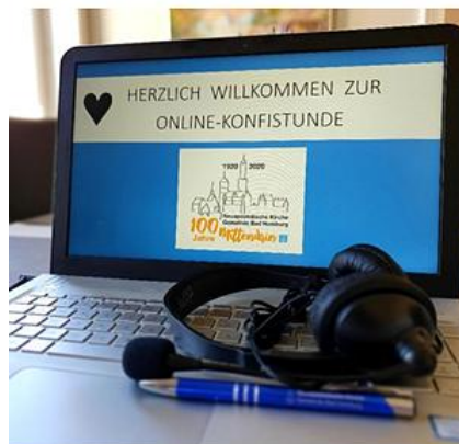
Online Konfirmandenstunde in Zeiten von Corona

Bereits Kleinkinder können in Gottesdiensten die Gemeinschaft in der Gemeinde erleben. Wer es möchte, kann auch die Eltern-und-Kind-Räume nutzen, die in den meisten Kirchen mit einer Glasscheibe zum Gottesdienstsaal versehen sind. Neben der Teilnahme von Kindern am Gottesdienst mit den Gemeinden gibt es für Kinder ab dem Grundschulalter spezielle Gottesdienstangebote.