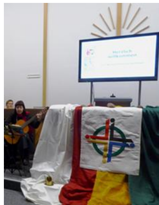
Weltgebetstag 2020 NAK-Bad Vilbel

Im Jahr 2020 fand der Weltgebetstag in der Neuapostolischen Kirchengemeinde Bad Vilbel statt. 2021 fand coronabedingt kein Gottesdienst in Bad Vilbel statt.