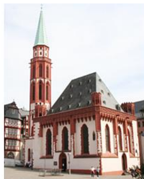
Alte Nikolaikirche auf dem Römerberg Frankfurt