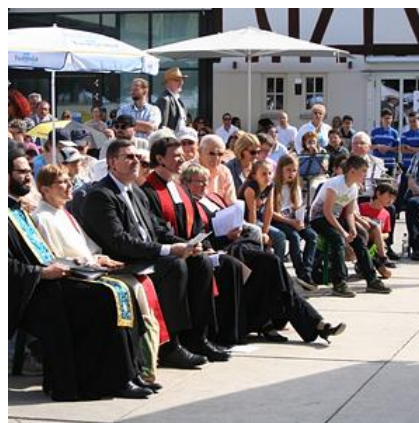
Ökumenischer Pfingstgottesdienst 2018