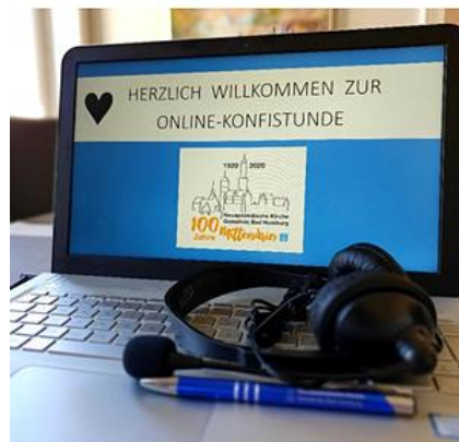
Online Konfirmandenstunde in Zeiten von Corona

Bereits Kleinkinder können in Gottesdiensten die Gemeinschaft in der Gemeinde erleben. Wer es möchte, kann auch die Eltern-und-Kind-Räume nutzen, die in den meisten Kirchen mit einer Glasscheibe zum Gottesdienstsaal versehen sind. Neben der Teilnahme von Kindern am Gottesdienst mit den Gemeinden gibt es für Kinder ab dem Grundschulalter spezielle Gottesdienstangebote.