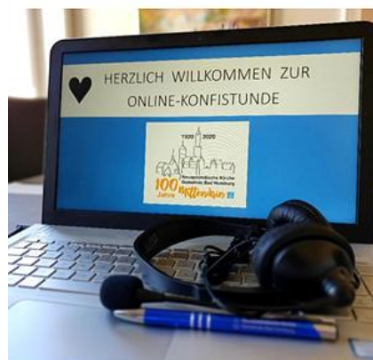
Online Konfirmandenstunde in Zeiten von Corona

Bereits Kleinkinder können in Gottesdiensten die Gemeinschaft in der Gemeinde erleben. Wer es möchte, kann auch die Eltern-und-Kind-Räume nutzen, die in den meisten Kirchen mit einer Glasscheibe zum Gottesdienstsaal versehen sind. Neben der Teilnahme von Kindern am Gottesdienst mit den Gemeinden gibt es für Kinder ab dem Grundschulalter spezielle Gottesdienstangebote.