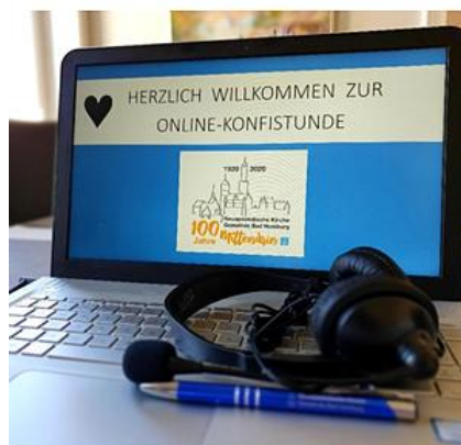
Online Konfirmandenstunde in Zeiten von Corona

Bereits Kleinkinder können in Gottesdiensten die Gemeinschaft in der Gemeinde erleben. Wer es möchte, kann auch die Eltern-und-Kind-Räume nutzen, die in den meisten Kirchen mit einer Glasscheibe zum Gottesdienstsaal versehen sind. Neben der Teilnahme von Kindern am Gottesdienst mit den Gemeinden gibt es für Kinder ab dem Grundschulalter spezielle Gottesdienstangebote.