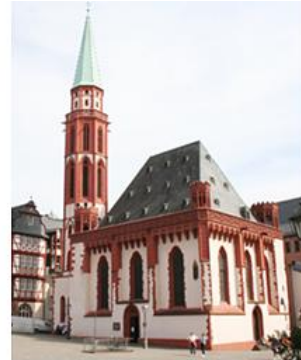
Alte Nikolaikirche auf dem Römerberg Frankfurt

Seit der Corona bedingten Aussetzung sucht man nach neuen Wegen. Einmal monatlich gibt es vor dem Gemeindezentrum der Freien ev. Gemeinde im Oeder Weg ab 18 Uhr die Möglichkeit zusammen zu beten und zu singen. Als Zeichen der Verbundenheit und Versöhnung prägen Gebete und Lieder in mehreren Sprachen die Veranstaltung.